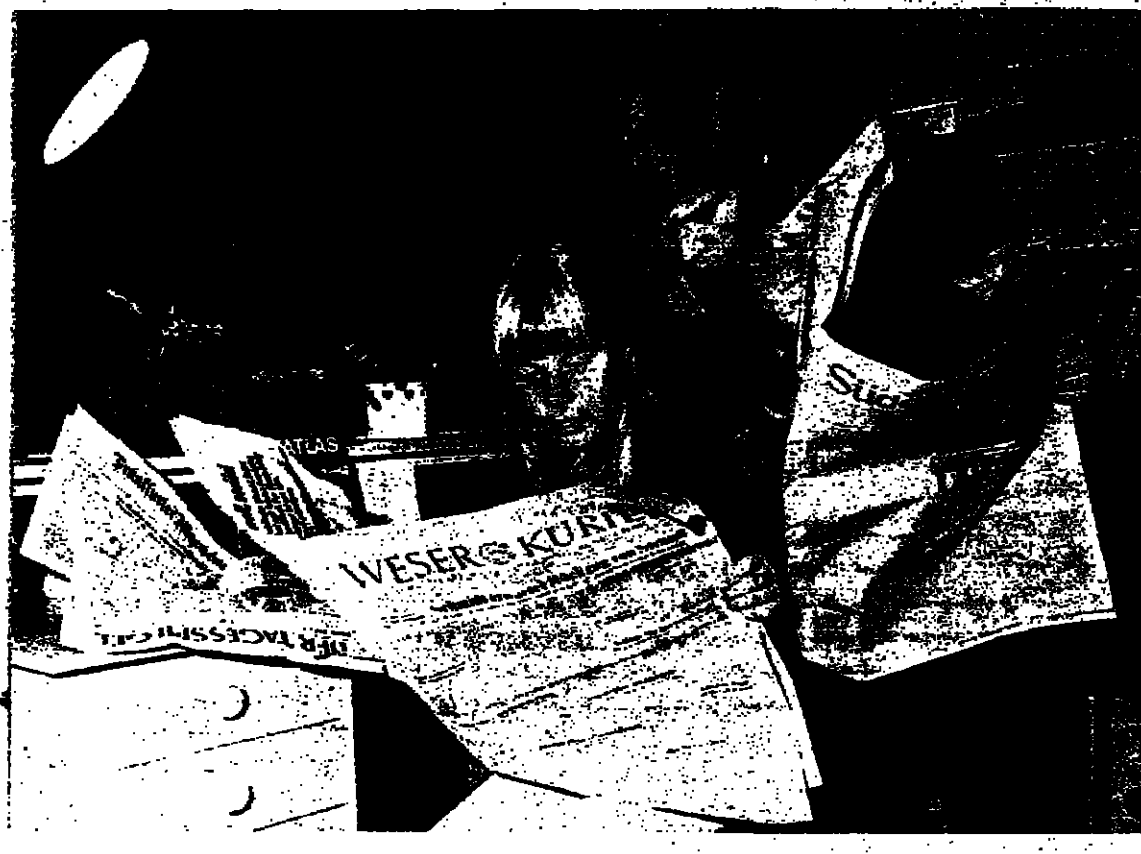
هابورج - أصبحت تعبر مطالعة الصحف نرسا من فروع التدريس في احدى مدارس المتنا...